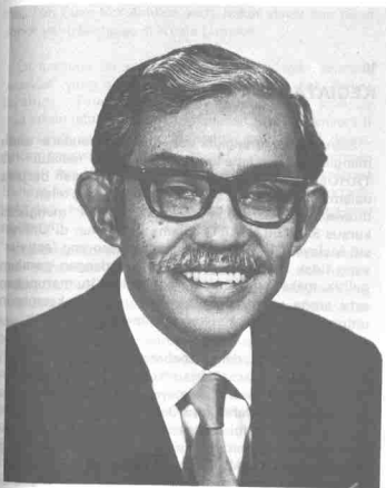
Allahyarham Tun Dr. Ismail, bekas Timbalan Perdana Menteri/ Menteri Dalam Negeri adalah salah seorang menteri yang mempunyai intergriti yang murni.