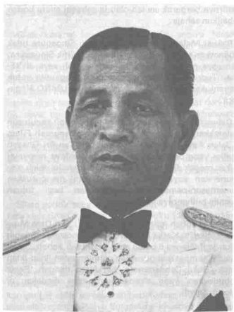
Tun Dato Mustapha, bekas Ketua Menteri Sabah dan Presiden USNO pada satu masa sangat berkuasa dan ditakuti di Sabah.