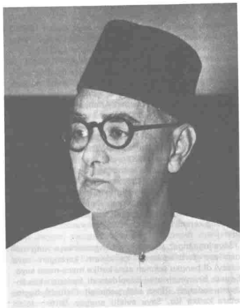
Allahyarham Dato Onn bin Jaafar. Saya mengkagumi cara beliau berpidato.