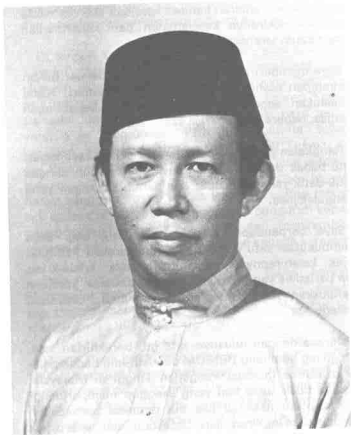
Dato Musa Hitam, Menteri Pelajaran. Satu masa dahulu dianggap 'Young Turk' dalam UMNO. Saya tidak nampak benarnya anggapan bahawa beliau adalah seorang 'leftist'. Mungkin beliau 'centre-rightist'.